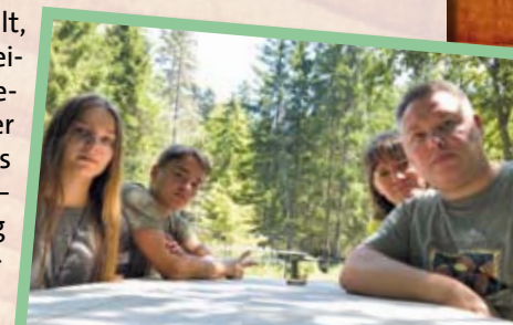
Mit der Familie in der Natur