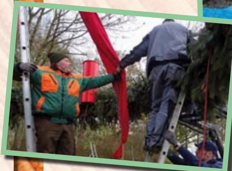
Hol(t)z arbeitet ... ... in der Dorfgemeinschaft Achtermeer

Einen ganz besonderen Stellenwert nimmt für mich die Mitwirkung in Feuerwehr, THW und vielen anderen Organisationen ein, hier übernehmen Menschen – in ihrer Freizeit – freiwillig kommunale Aufgaben, die sonst nicht zu stemmen wären.