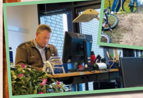
... voller Energie an seinem Arbeitsplatz

und viele „Verlierer“ gibt, führt zu Politikverdrossenheit und hat allemal ausgedient. Die Gesellschaft richtig zu vertreten, heißt: „Menschen zusammenbringen!“ Dies zu praktizieren, ist eines meiner wichtigsten Ziele.